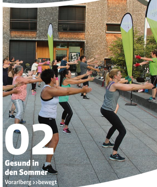
02 Gesund in den Sommer Vorarlberg >>bewegt

Mit seinen beliebten Aktionen, wie >>bewegt in den Tag startet Vorarlberg >>bewegt im Juni wieder durch. An diversen Standorten im ganzen Land wird ein Fitness-Programm der besonderen Art geboten. Daneben finden Bewegungstreffs, Wanderwochen und der Bergerlebnistag statt. Ein kostenfreies Bewegungs-Programm für alle Vorarlbergerinnen und Vorarlberger.