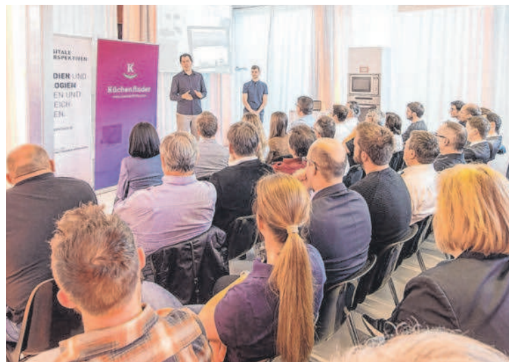
Die Serviceinitiative „Digitale Perspektiven“ zeigt anhand unterschiedlichster Praxisbeispiele die Auswirkungen und Wege neuer Medien und Technologien. wkv

Dazu finden u. a. digitale Stammtische und Werkstattgespräche direkt